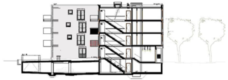
» Section » Schnitt