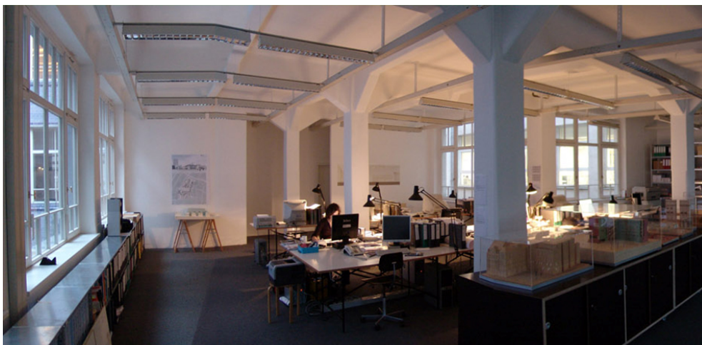
Blick in die Leipziger Büroflächen von kister scheithauer gross architekten und stadtplaner

„Es gehört zu den großen Stärken – und Selbstverständlichkeiten – von ksg, mit architektonischen Interventionen immer auch einen nachhaltigen Beitrag für den Stadtraum zu leisten“, beschreibt Architekturjournalist Oliver G. Hamm die Arbeit des Büros. Gut ablesbar ist dies an Projekten wie dem Händelhaus-Karree in Halle/Saale, der Hochschule Bremerhaven oder aber dem Gerling-Areal in Köln. Alles Gebäudeensembles, die einerseits immer den Bestand ernst nehmen und eine Korrespondenz von Alt- und Neubauten ermöglichen. Andererseits setzen die Neubauten von ksg – wie etwa die Synagoge in Ulm oder die Doppelkirche in Freiburg – stets auch eigene architektonische Akzente und definieren den Freiraum neu. Die Sorgfalt im Umgang mit der Umgebung brachte dem Büro beachtliche Ausstellungen in der Architekturgalerie Aedes in Berlin und im Deutschen Architektur Museum in Frankfurt.